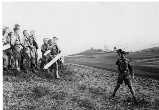
Bild Rauschenberg (Petersberger Hitlerjungen am Rauschenberg mit Modellflugzeug, im Hintergrund der Gehaus-/ Marienküppel)

erlernen. Eine Familie in der Rab.-Maurus-Straße stellte ihre alten Stallungen zur Verfügung und die Hitlerjugend richtete sich diese als Bastelräume her. Nach Fertigstellung der Modelle wurden diese anschließend entweder am Petersberger Sportplatz ausprobiert, der sich als zentral gelegener Platz dafür anbot oder man ging an die Hänge des Rauschenbergs.